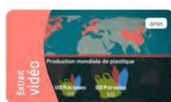
Capsule vidéo : Pollution plastique, état des lieux et solutions ↗