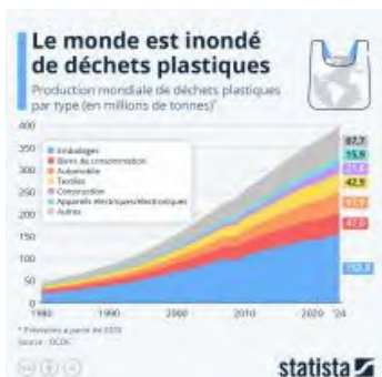
Infographie : Le monde est inondé de déchets plastiques ↗

Parmi les différents sujets traités, la pollution plastique est bien sûr présente ↗ .