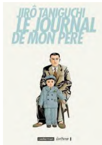
Le journal de mon père