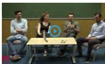
Fresque du Climat 2024 - Table ronde Amphi 2

Sur les deux campus, vos bibliothèques se sont mobilisées pour la Fresque du Climat ! Pour prolonger l'événement et poursuivre vos réflexions sur le rôle des ingénieurs face au changement climatique, vous pouvez consulter cette sélection d'ouvrages . La vidéo de l'une des deux tables rondes est déjà en ligne !