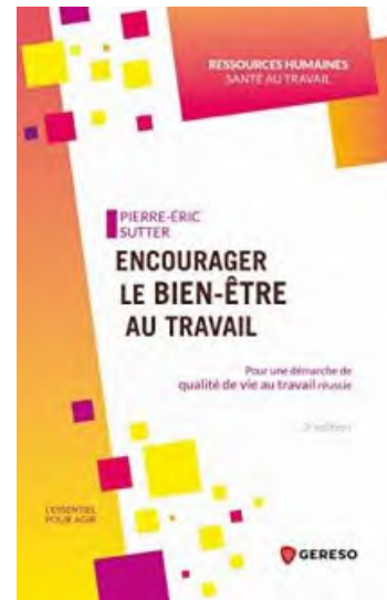
Encourager le bien-être au travail