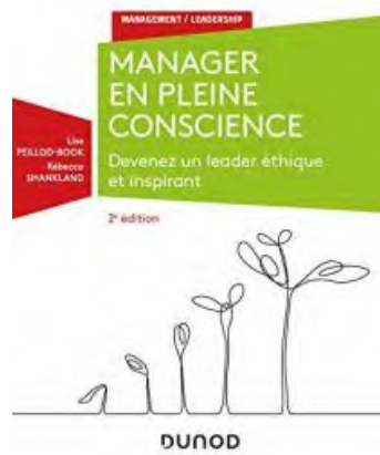
Manager en pleine conscience : devenez un leader éthique et inspirant